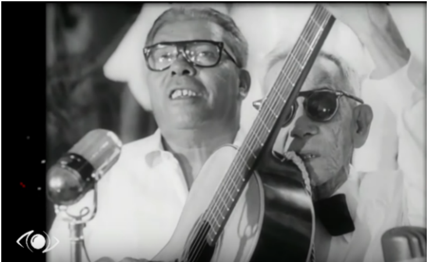
Sindo Garay cantando “Mujer Bayamesa” junto a su hijo.

Esta emisión abordó los cambios operados en Cuba en los primeros veinte meses de Revolución en el poder, desde enero de 1959 hasta la Primera Declaración de La Habana.