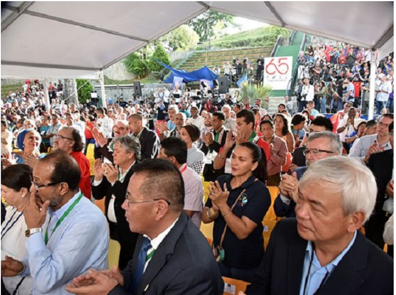
Reunión XXV del Foro de Sao Paulo, en Caracas, Venezuela.

Para colmo, una pandemia de inéditas dimensiones, cuyo impacto no solo ha de ser visto en términos de infectados y fallecidos, que ya es de por sí doloroso, sino también en las huellas que está dejando y dejará en las economías.