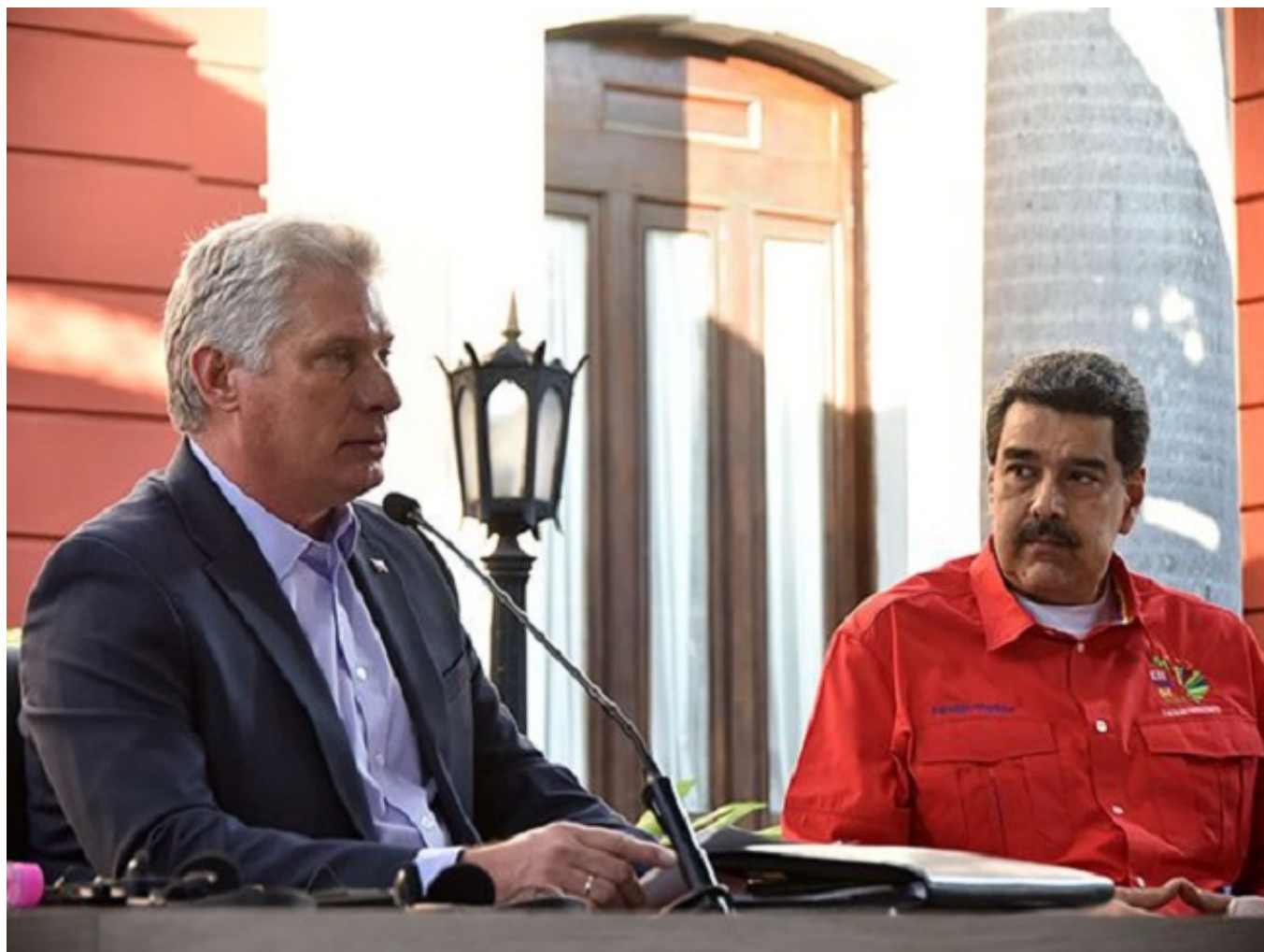
Presidente cubano Miguel Díaz-Canel Bermúdez, durante la clausura de la Reunión XXV del Foro de Sao Paulo

“El Foro está aquí y estará y tiene mucho que hacer porque es otra vez ‘la hora de los hornos, en que no se ha de ver más que la luz’. Esta luz es la unidad, el gran legado que nos dejaron nuestros próceres, de Bolívar a Martí, Fidel y Chávez”.