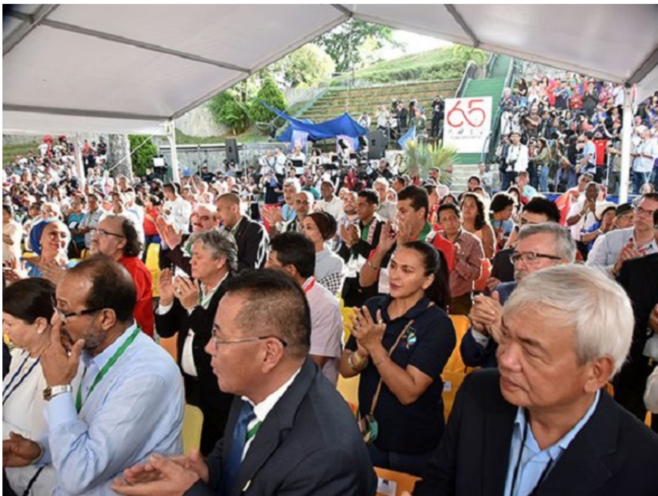
Reunión XXV del Foro de Sao Paulo, en Caracas, Venezuela.

Para colmo, una pandemia de inéditas dimensiones, cuyo impacto no solo ha de ser visto en términos de infectados y fallecidos, que ya es de por sí doloroso, sino también en las huellas que está dejando y dejará en las economías.