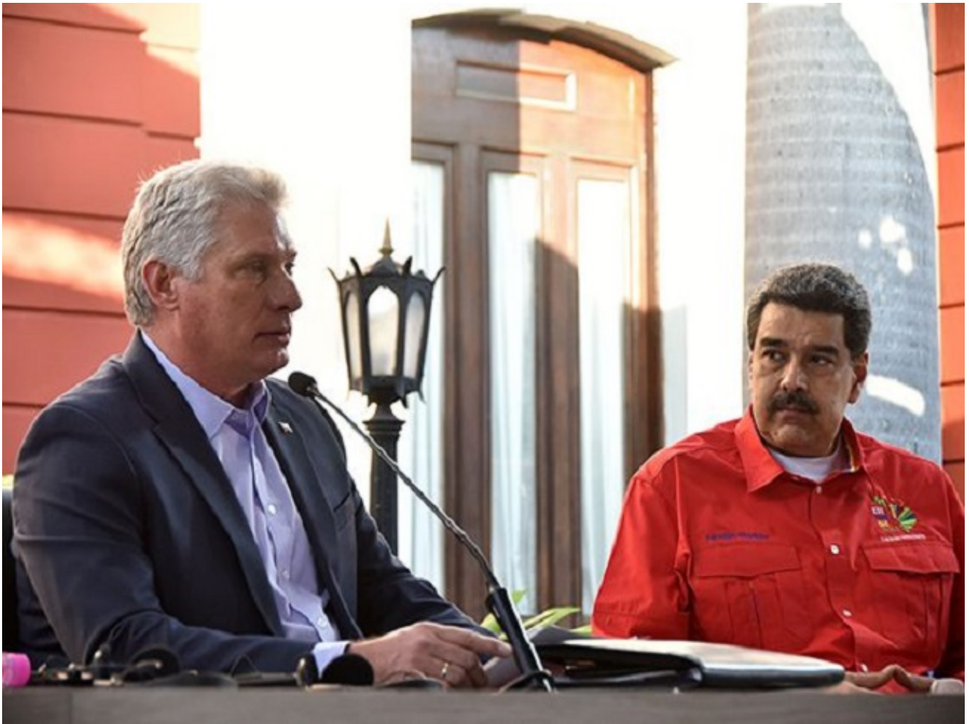
Presidente cubano Miguel Díaz-Canel Bermúdez, durante la clausura de la Reunión XXV del Foro de Sao Paulo

“El Foro está aquí y estará y tiene mucho que hacer porque es otra vez ‘la hora de los hornos, en que no se ha de ver más que la luz’. Esta luz es la unidad, el gran legado que nos dejaron nuestros próceres, de Bolívar a Martí, Fidel y Chávez”.